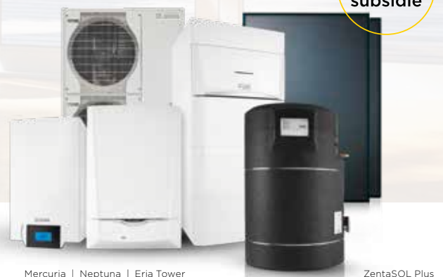
Mercuria | Neptuna | Eria Tower